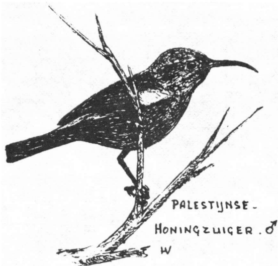
PALESTIJNSE - HONINGZUIGER. ♂ W

Veel vogels hebben we overigens niet gezien in Jerusalem. Enkele groepjes Kleine Torenavalken vlogen boven de stadswallen. Verder zag ik enkele Vlaamse Gaaien, Koolmezen en Merels. Ook een Palestijnse Honingzuiger liet zich zien.