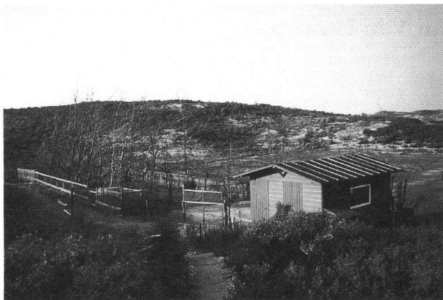
Vinkenbaan Van Lennep in 1970 (Anonymus).

Na een aantal koude en klamme uren zat de eerste vogel onder het net. Met veel euforie werd de Vink onder het slagnet vandaan gehaald, en wat bleek, het was één van de lokkers die zich had weten te bevrijden en het voer bij het slagnet was gaan opzoeken! Echter niet getreurd, de ware "vinker" laat zich door zijn kleine tegenslag niet uit het veld slaan! Het VT werd opnieuw benaderd met het verzoek om eens een aantal dagen de kunst in Wassenaar te mogen afkijken. Uiteindelijk werden de eerste trekvogels in 1958 voorzien van edelmetaal.