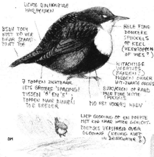
Waterpreeuw Middenveld AW-duinen, 10 december 2001 (Dirk Moerbeek)