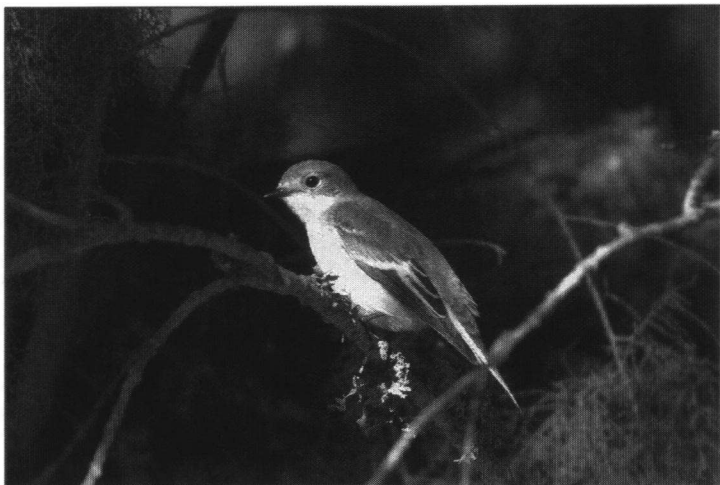
Bij ons doortrekkende Bonte Vliegenvangers vertoeven in oktober al in Marokko. Arnoud van den Berg