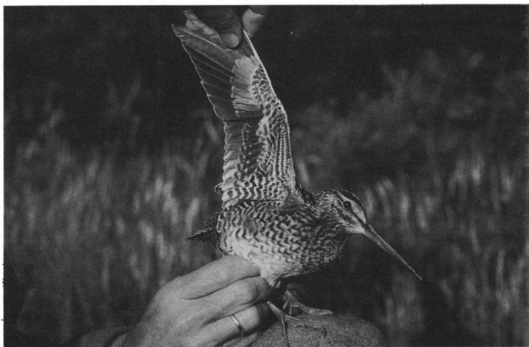
De Poelsnip van de AW-duinen; letterlijk èn figuurlijk een 'zware' soort.