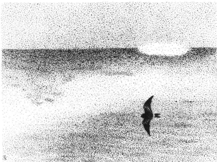
Het enige Vaaltje van het jaar passeerde de telpost op 5 oktober. Roy Slaterus.

De rustige zomer werd in oktober ruimschoots gecompenseerd. De maand begon met 21 Lepelaars op de 1 e . Nauwelijks een week later begon het flink uit westelijke richting te waaien. Dankzij het chauffeur van Pim precies op tijd op de telpost om het enige Vaal Stormvogeltje van 2002 mee te pikken, een fraai exemplaar dat door de branding naar zuid keilde. De wind draaide vervolgens naar de oosthoek, hetgeen o.a. 16 Lepelaars en 21 Kleine Zwanen op de 10 e en een Geelpootmeeuw op de 11 e 'opleverde'.