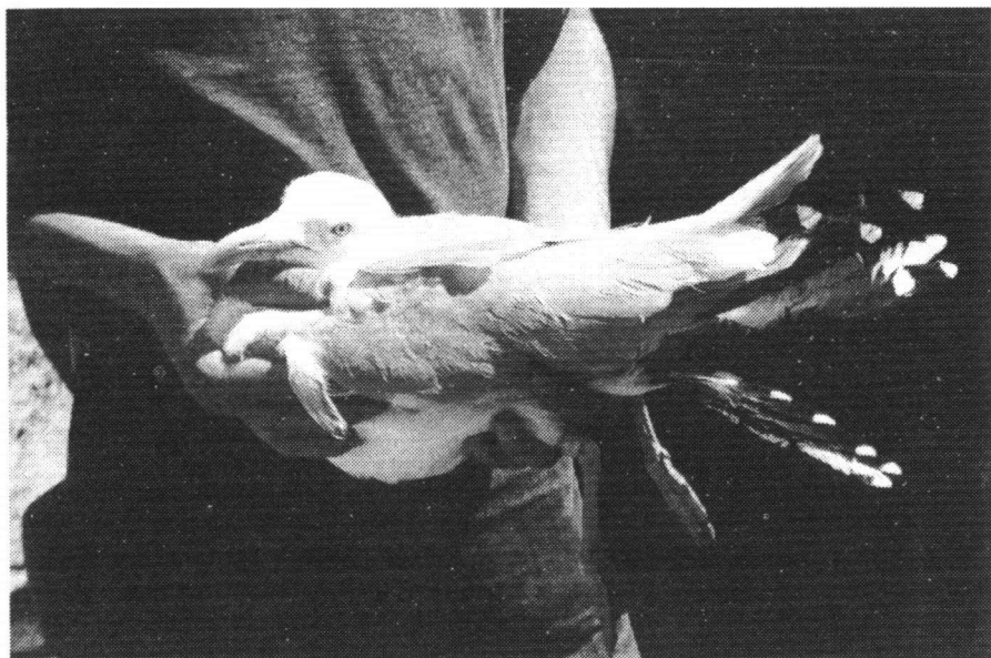
Zilvermeeuw (adulte man) gevangen met inlooptkooi op nest, Vlissingen-Oost, Van Cittershaven 25 mei 2001 Herring Gull Larus argentatus (adult male) trapped on the nest

Naarmate de vogels ouder werden keerden zij jaarlijks vroeger terug naar de geboortegrond op Schouwen, in veel gevallen zelfs vóór half januari. Voorts werd ontdekt dat er een bijzonder grote trouw aan de geboortekolonie was: 75% van de mannetjes keerde terug als broedvogel tegen zo'n 40% van de vrouwtjes. Tijdens het broedseizoen werden vanuit de meeuwenduinen foerageergebieden (met name open vuilstorten, getijdenwateren) tot op 20-25 km afstand bezocht, soms zelfs tot op 47 km of, voorafgaande aan de eileg, bijna 100 km.