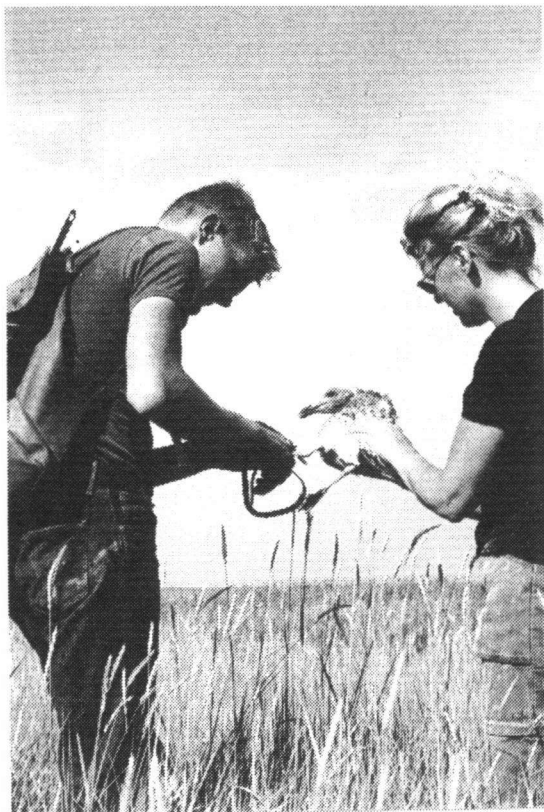
Het ringen van een jonge Zilvermeeuw op het Verdrongen land van Saeftinghe, 5 juli 2001 Ringing of a juvenile Herring Gull Larus argentatus .

De Zilvermeeuw Larus argentatus is een talrijke broedvogel, in ons land zo'n 67.000-90.000 paren in de jaren 1992-1997 (Bijlsma e.a. 2001). Mede daardoor is deze meeuwensoort ook veel geringd door de jaren heen (zie tabel 1 en 5). Merk hierbij op dat de aantallen uit tabel 5 niet geheel overeen komen met die uit tabel 1, vanwege het feit dat vanaf grofweg 1960 pas alle ringgegevens gestandaardiseerd in de databank van het Vogeltrekstation staan.