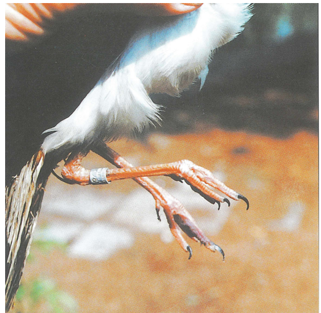
Figuur 2. Door Henk v.d. Starre op 22 februari 1995 gevangen te Reeuwijk. Overjarige man. Pootkleur oranje-rood. Mogelijk een roodpoot? Voor een versie in kleur zie: http://www.vogeltrekstation.nl/informatie-voor-ringers/downloads (Foto' roodpootkievit')

is de kans aanwezig dat de pootkleur door jarenlange gevangenschap iets gaat verbleken.