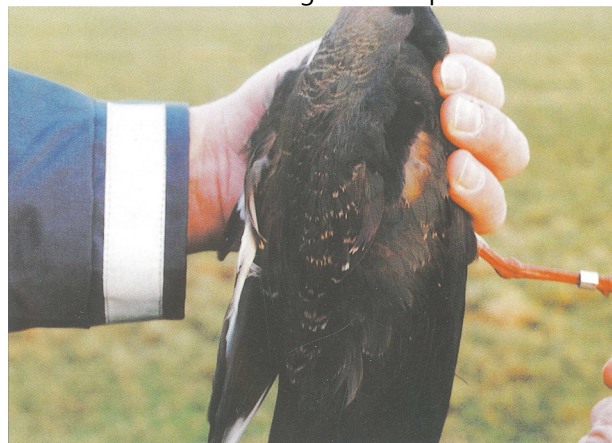
Figuur 1. Overjarige man, gevangen in winterperiode op 14 februari 2000, Matsloot (Dr). Pootkleur oranje-rood. Mogelijk een roodpoot? Voor een versie in kleur zie: http://www.vogeltrekstation.nl/informatie-voor-ringers/downloads (Foto' roodpootkievit)

Om 11 uur heb ik zes kieviten en bel Keimpe. Het gaat lekker, we vangen 11 wilsters en 25 kieviten, waarvan één met een duidelijk afwijkende pootkleur. "Maar" schrijf ik in mijn dagboek "Durk Wassenaar zal het wel geen roodpoot noemen".