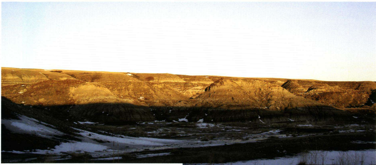
De Canadese versie van de Grand Canyon, de Badlands