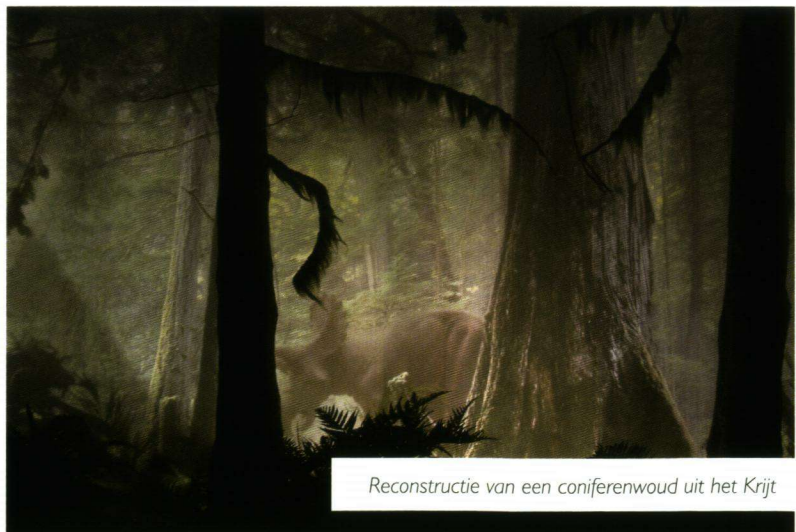
Reconstructie van een coniferenwoud uit het Krijt

niet verwonderlijk dat de vaste tentoonstelling voor het grootste deel aan deze reuzenhagedissen en hun tijdgenoten is gewijd. Meteen na binnenkomst al stap je 70 miljoen jaar terug in de tijd naar