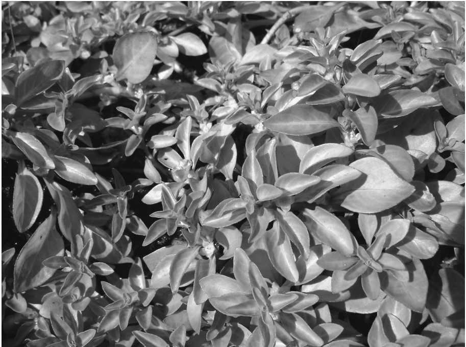
Fig. 6. Ludwigia palustris (L.) Elloitt (Waterlepelje).

Leontodon hispidus (Ruige leeuwentand): Wemeldingen, Zuidelijke Snoodijkpolder, gemaaid of wellicht later extensief begraasd, 48.28 (opg. W. van Wijngaarden).