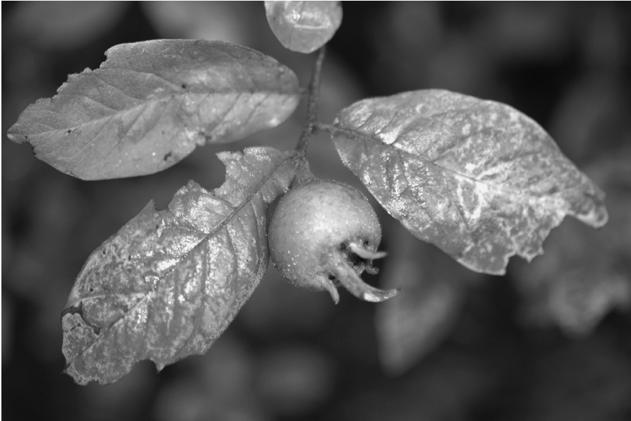
Fig. 7. Vrucht van Mespilus germanica L. (Mispel).

Montia fontana (Groot bronkruid): Vaassen, in het Korte Broek, aan rand van sloot loodrecht op de Egelbeek, 33.23 (opg. J.H.P. Bruinsma).