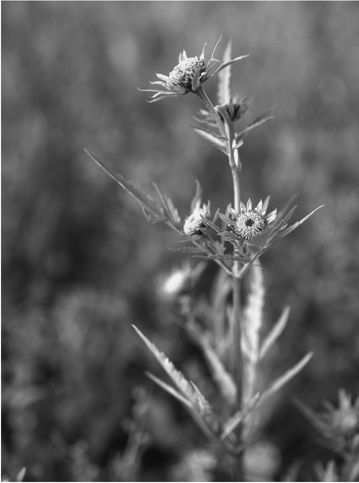
Fig. 2. Bidens radiata Thuill. (Riviertandzaad).

Bromus racemosus (Trosdravik): bij Zenderen in greppelkant en bij Borne in berm, 28.46 (P.F. Stolwijk) / Cortenoever, in extensief grasland, 33.47 (B. Odé) / Maasbommel, Polderse Blok, aan akkerrand en in wegberm (M. Michiels/ vegetatie-werkgroep IVN-Oss) / Almkerk, in wegberm, 44.16 (opg. P. van Ruth).