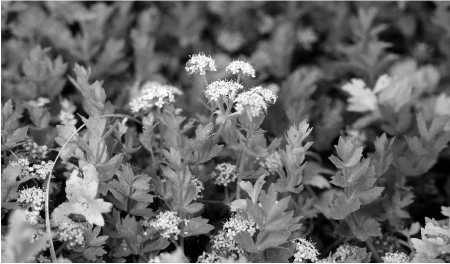
Fig. 1. Apium repens (Jacq.) Lag. (Kruipend moerasscherm).

Anthemis tinctoria (Gele kamille): Steenwaard, op zandige plekken in met paarden beweide uiterwaard, 39.21 (R. Beringen).