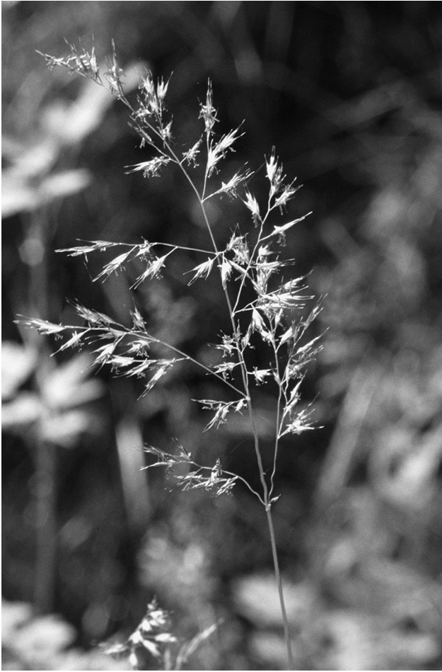
Fig. 4. Festuca heterophylla Lam. (Draadzwenkgras).

Glaucium flavum (Gele hoornpapaver): Zierikzee, op steenglooing van dijk langs Havenkanaal, 42.47 (opg. PWG Schouwen-Duiveland).