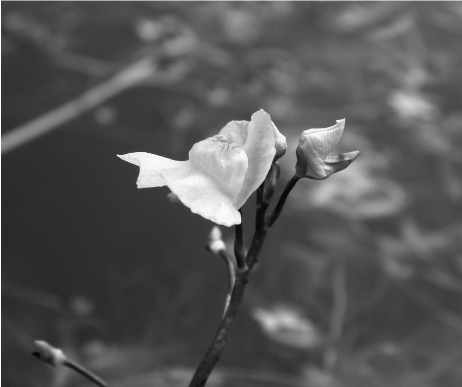
Fig. 13. Bloeiwijze van Utricularia australis R.Br. (Loos blaasjeskruid).

Utricularia intermedia (Plat blaasjeskruid): langs A6 door Tjeukemeer, in strook rietland langs weg begrensd door stortsteen, met Sphagnum squarrosum en Calliergonella cuspidata , 16.11 (H. Waltje). –Van deze soort wordt zelden of nooit een nieuwe vindplaats ontdekt.