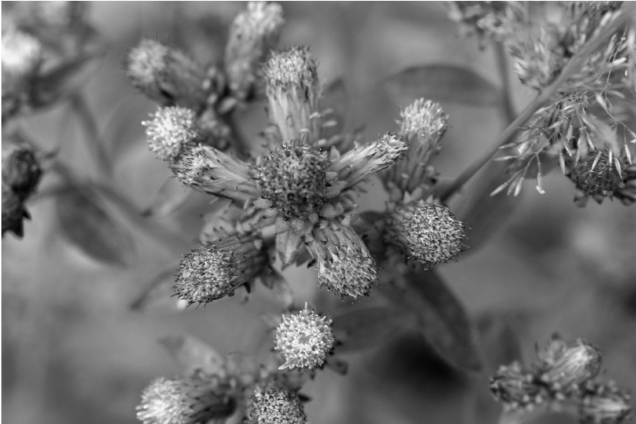
Fig. 5. Hoofdjes van Inula conyzae (Griess.) Meikle (Donderkruid).

Inula britannica (Engelse alant): Wassenaar, natuurontwikkelingsproject Lentevreugd op voormalig bollenland, 30.36 (opg. K. Langeveld).