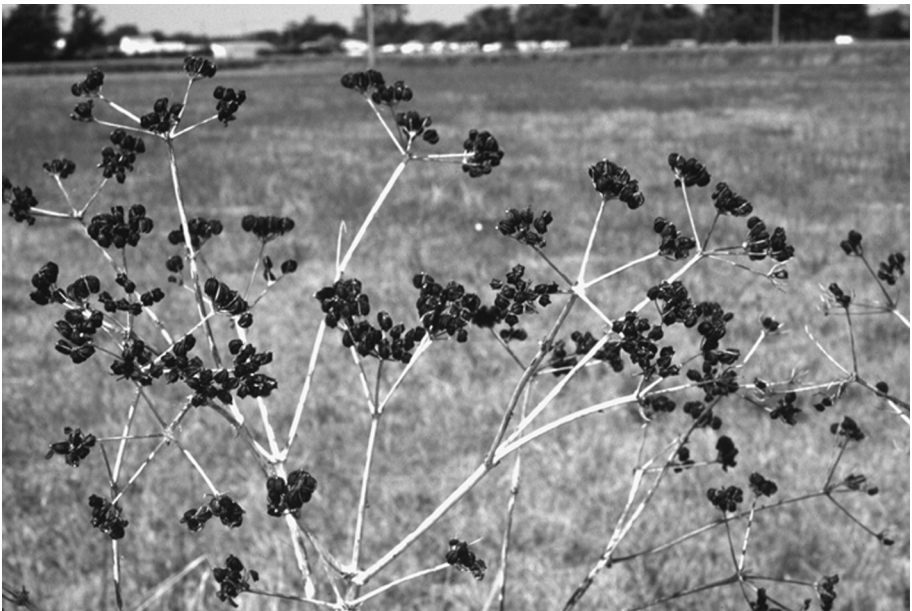
Fig. 12. Vruchten van Smyrniolus atrum L. (Zwartmoeskervel).