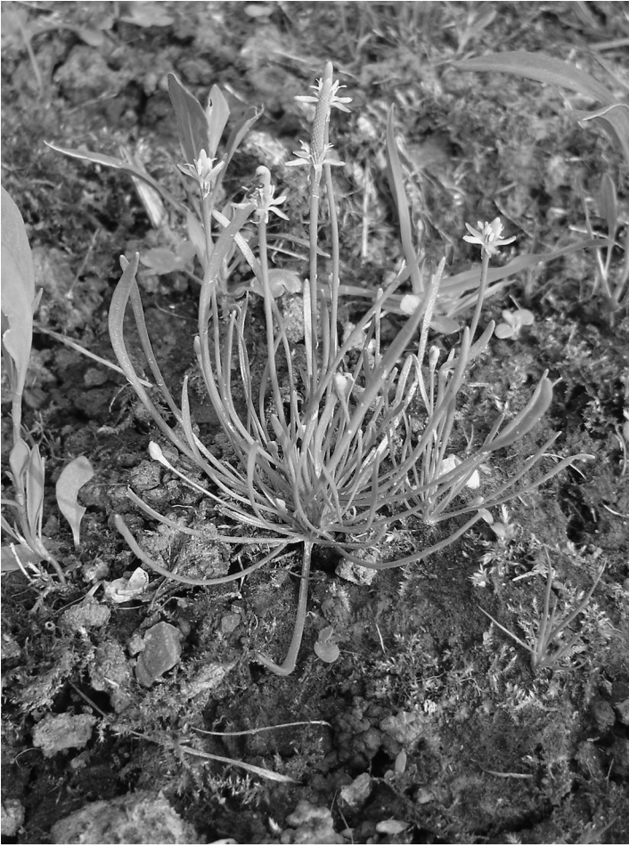
Fig. 8. Myosurus minimus L. (Muizenstaart).

Nymphoides peltata (Watergentiaan): Beetgum, 5.48 (opg. P. Bremer). – In N.W.-Friesland was de soort niet eerder gevonden.