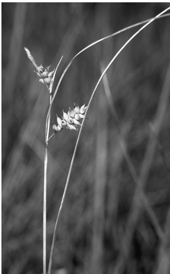
Fig. 3. Bloeiwijze van Carex punctata Gaudin (Stippelzegge).

Callitriche truncata (Doorschijnend sterrenkroos): Diemerzeedijk, aan de voet van de dijk, in ca. 30 cm diep water, met Potamogeton pusillus , 25.46 (R. Beringen).