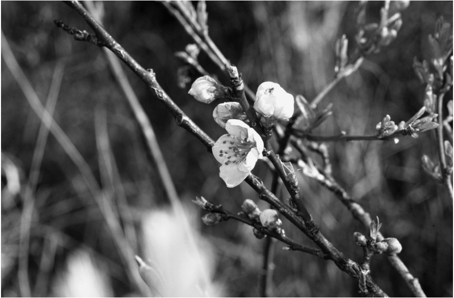
Fig. 10. Prunus persica (L.) Batsch (Perzik).