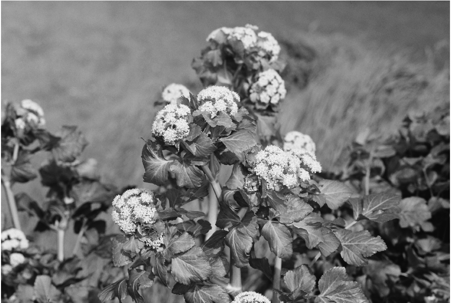
Fig. 11. Bloeiwijze van Smyrniolus atrum L. (Zwartmoeskervel).