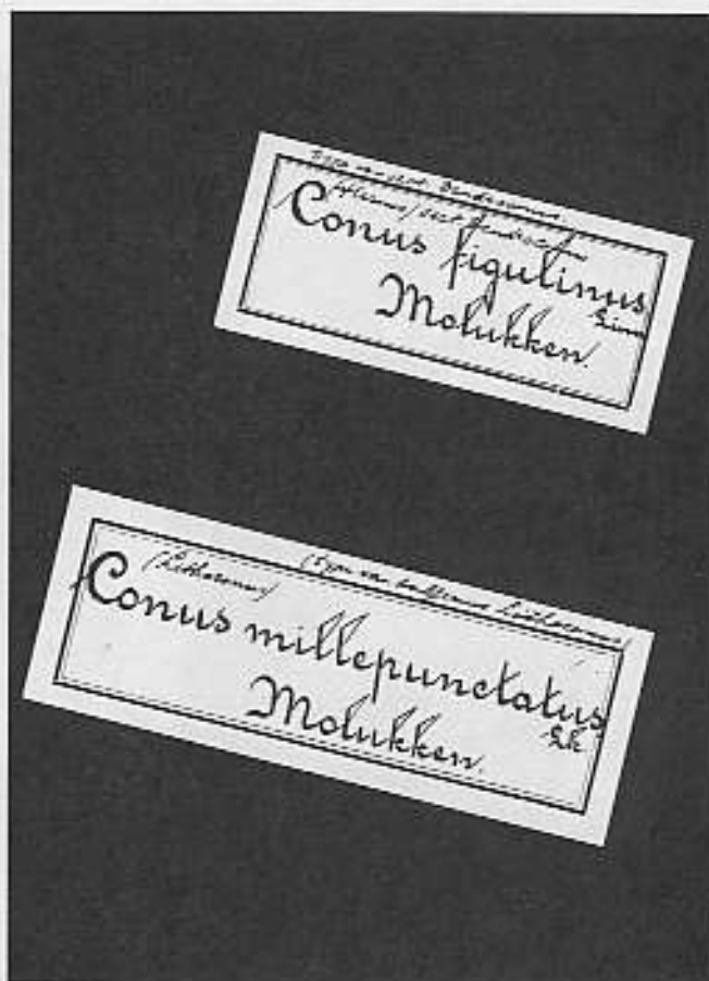
originele etiketten uit de oude Rotterdamsche Diergaard, met aantekeningen van Schepman