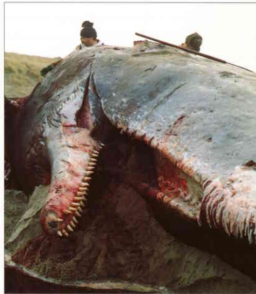
Zaterdagochtend: er druipt al spermaceti uit een 'litteken' in de kop