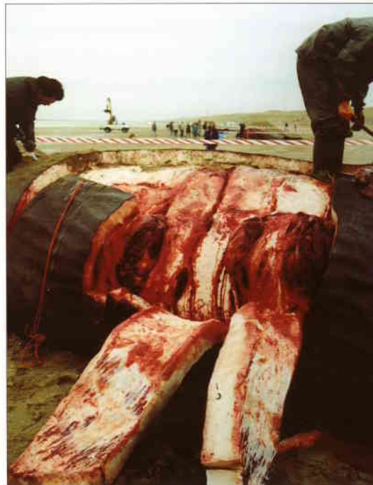
Vrijdagochtend: het afspekken is begonnen

nu al groot. Met een shovel worden rondom onze potvis palen het zand in geramd. De politie spant er rood-wit lint tussen. Ook werpt men alvast een dijk op rond elke potvis om het opkomende water te keren. Ons zeiltje met spullen ligt zo ook wat veiliger. Ik maak foto's van het afspekken. Een vrachtwagen met grijper bewijst goede diensten: hij trekt de repen los en voert ze meteen af. Om tien uur verschijnt de ploeg preparateurs van het Leidse NNM. Er wordt wat gemord over onze voortvarende aanpak, maar de onmisbare flensmessen en vleeshaken (nog van de 'Willem Barendsz') worden eerlijk verdeeld. De Leidenaren beginnen aan de middelste potvis. Smeenk meldt dat Museum Natura Docet in Denekamp ook belangstelling voor een skelet heeft getoond.