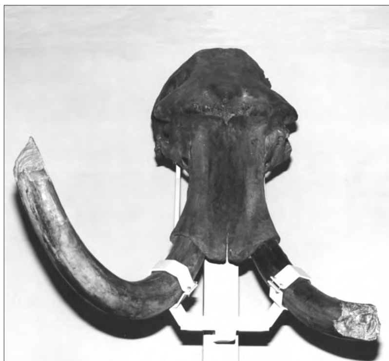
DE MAMMOETSCHEDL DIE IN 1962 WERD VER WORVEN, IS NOG STEEDS EEN TOPSTUK VAN HET MUSEUM.