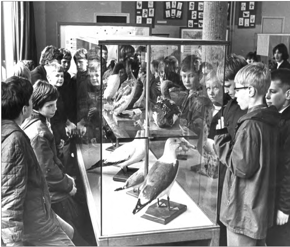
EEN SCHOOLKLAS BEZOECT HET NATUURHISTORISCH MUSEUM, 5 APRIL 1967.

'Het invoegen van het Natuurhistorisch Museum als een gewone afdeling van de Diergaarde heeft heel wat voeten in de aarde gehad en ter zake moge hier dan ook verwezen worden naar de betreffende bundel. Waar deze zaak echter voor de Diergaarde zeer bepaalde, helaas niet uitsluitend voordelige, consequenties heeft medegebracht moge toch met een enkel woord worden vastgelegd waarom deze annexatie heeft plaats gehad. In het jaar 1955 werd het duidelijk dat de Burgemeester gaarne de beschikking wilde verkrijgen over het tegenover Museum Boijmans gelegen pand waarin het Natuurhistorisch Museum gevestigd was. Terzelfder tijd was men van plan in de Diergaarde een Aquarium te bouwen, terwijl men niet goed wist welke bestemming het best aan het in de grote vijver gelegen platvorm gegeven zou kunnen worden. Verwacht werd dat de Gemeente er heel wat voor over zou hebben om het huis waarin het museum gevestigd was weer ter beschikking te krijgen en dat zich hierdoor perspectieven voor de Diergaarde openden