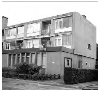
HET PAND KASTANJESINGEL 107 (HOEK PEPPELWEG) TE ROTTERDAM- SCHIEBROEK, JULI 2001, WAAR HET MUSEUM IN 1960 WERD GEHUISVEST.

ders gelijkwaardig geacht kon worden aan de ruimte die de vereniging prijs gaf. B & W tekende hierbij aan dat ook op andere, door het college goed te keuren, wijze op het terrein van de Diergaarde een oplossing zou kunnen worden gevonden.