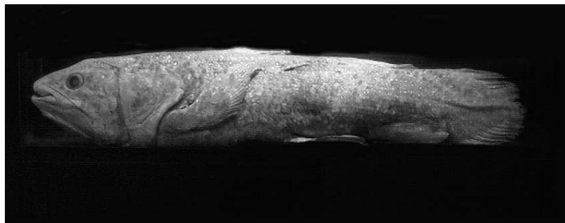
DE 46 E COELACANTH ( LATIMERIA CHALUMNAE ), WERD IN AUGUSTUS 1965 BIJ DE COMOREN OPGEVIST. COLLECTIE NATURALIS, REG. NR. 25120.

Tussen al het boekengeweld is de 'Vitrinekast met pinguïns van steen, hout, plastic et cetera.' een verademing. Hier ziet men het soort verzameling waaraan iedereen wel eens begonnen is. Pinguïnverzamelaars