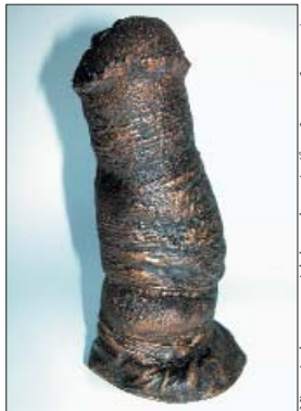
Nieuw in de museumwinkel: paardenpenis

De museumwinkel heeft in het kader van PLANT JE VOORT! een aantal zeer natuurgetrouwe afgietsels van een paardenpenis laten maken; te gebruiken als pressepapier of gewoon ter decoratie in de vensterbank. De in bronskleur uitgevoerde penissen kosten E 25,- per stuk en de voorraad is zeer beperkt.