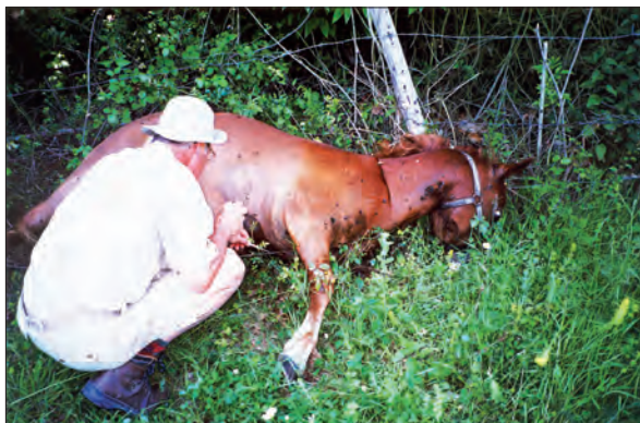
(LINKS) FON'S HEETMAN BOVEN OP HET VENETIAANSE FORT IN PARGA, GRIEKENLAND, JUNI 1994. (RECHTS) AASKEVERS VERZAMELEN BIJ EEN DOOD PAARD. AIR-SUR-L'ADOUR, FRANKRIJK, MEI 2002.