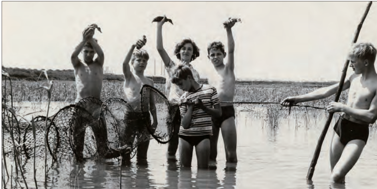
JONGE VOGELAARS OP HET OPSPUITTERREIN NABIJ DE WAALHAVEN IN 1963.

en over de daar in dezelfde periode broedende patrijzen en bosrietzangers. Ja, zelfs zouden er boompiepers hebben gezeten.