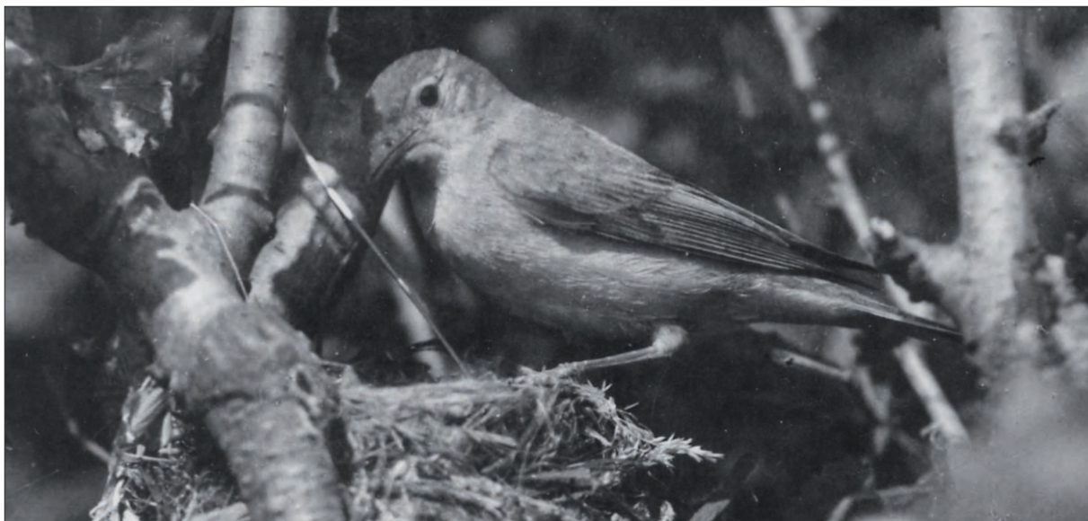
SPOTVOGEL OP HET NEST, IN JUNI 1955.