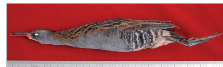
▲ De ral van Nozeman. (Kees Moeliker)

'De eendenman' van conservator Kees Moeliker vindt aftrek bij een groot lezerspubliek. Op veler verzoek is een kleine expositie ingericht met museumstukken die een belangrijke rol spelen in het boek. Zo zijn de ral van Nozeman te zien, de onthoofde duif en het befaamde ijzeren duivennest. Ook de Dominomus en de braakballen van de Rotterdamse kwakken zijn uit het depot gehaald.