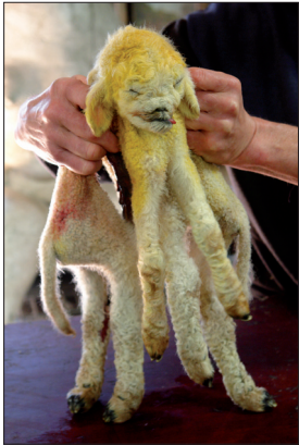
▲ De lammetjes van de Esch. (Kees Moeliker)

De twee lammetjes die medio april met een ernstig geboortedefect ter wereld kwamen in de schaapskudde van polder De Esch, zijn opgenomen in de collectie. Het gaat om een Siamese tweeling - een eeneiige - die in vaktermen wordt omschreven als een 'asymmetrische cephalopagus'. Hierbij zijn twee lammetjes vanaf de bovenkant van hun koppen tot de navel met elkaar vergroeid. De monstrositeit telt daarom één samengestelde kop, twee onderlichamen, acht poten en twee staarten.