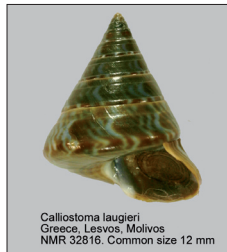
▲ Calliostoma laugierii.