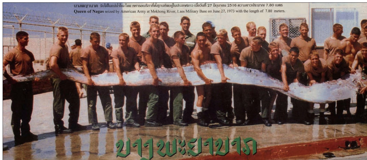
▲ De gewraakte foto van de haringkoning uit de Mekong.

toen haring nog niet als volksvoedsel verdrongen was door allerlei quasi duurzaam gekweekte vismerken, als voorbode van een rijke haringvangst gezien. De eigenaardig verlengde eerste stralen van de erg voorlijk gesitueerde rugvin vormen een soort kroon boven de kop en veroorzaken de Koninklijke naam en uitstraling. De 'King of herring' of 'oarfissh' komt in de oceanen aan beide zijden van de evenaar voor op dieptes van 500-1000 meter, mijdt koudere noor-