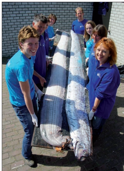
▲ De eerste Nederlandse haringkoningen spoelden aan op Texel en Vlieland.

delijke en zuidelijke wateren en is nauw verwant met de ongeveer drie meter lange bandvis ( Trachipterus arcticus ) waarvan de eerste vangst uit Nederlandse wateren in de NMR-collectie is opgenomen.