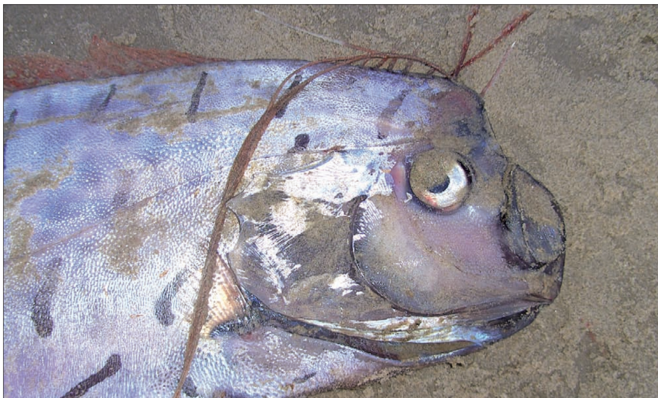
▲ De kop van de haringkoning van Texel. (Jan van Brenk)