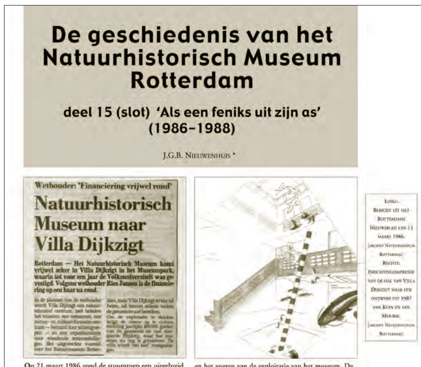
▲ Het laatste deel van de reeks 'De geschiedenis van het Natuurhistorisch Museum Rotterdam' door J.G.B. Nieuwenhuis in Straatgras 17: 3-7.

Een interview met Jan Nieuwenhuis verscheen in de serie 'De collectiebeheerders' in Straatgras 6 (2) juli 1994.