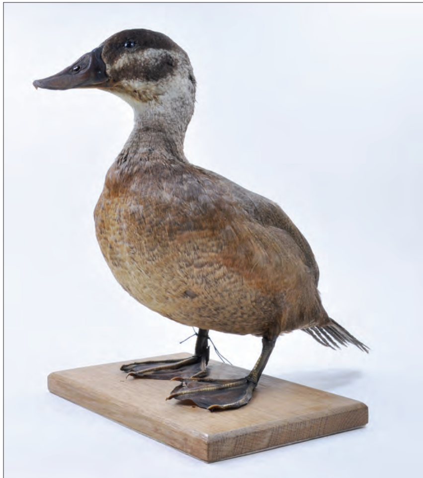
▲ De witkopeend van het Schollevaarseiland, maart 1851; collectie Natuurhistorisch Museum Rotterdam, NMR 9989-001296.