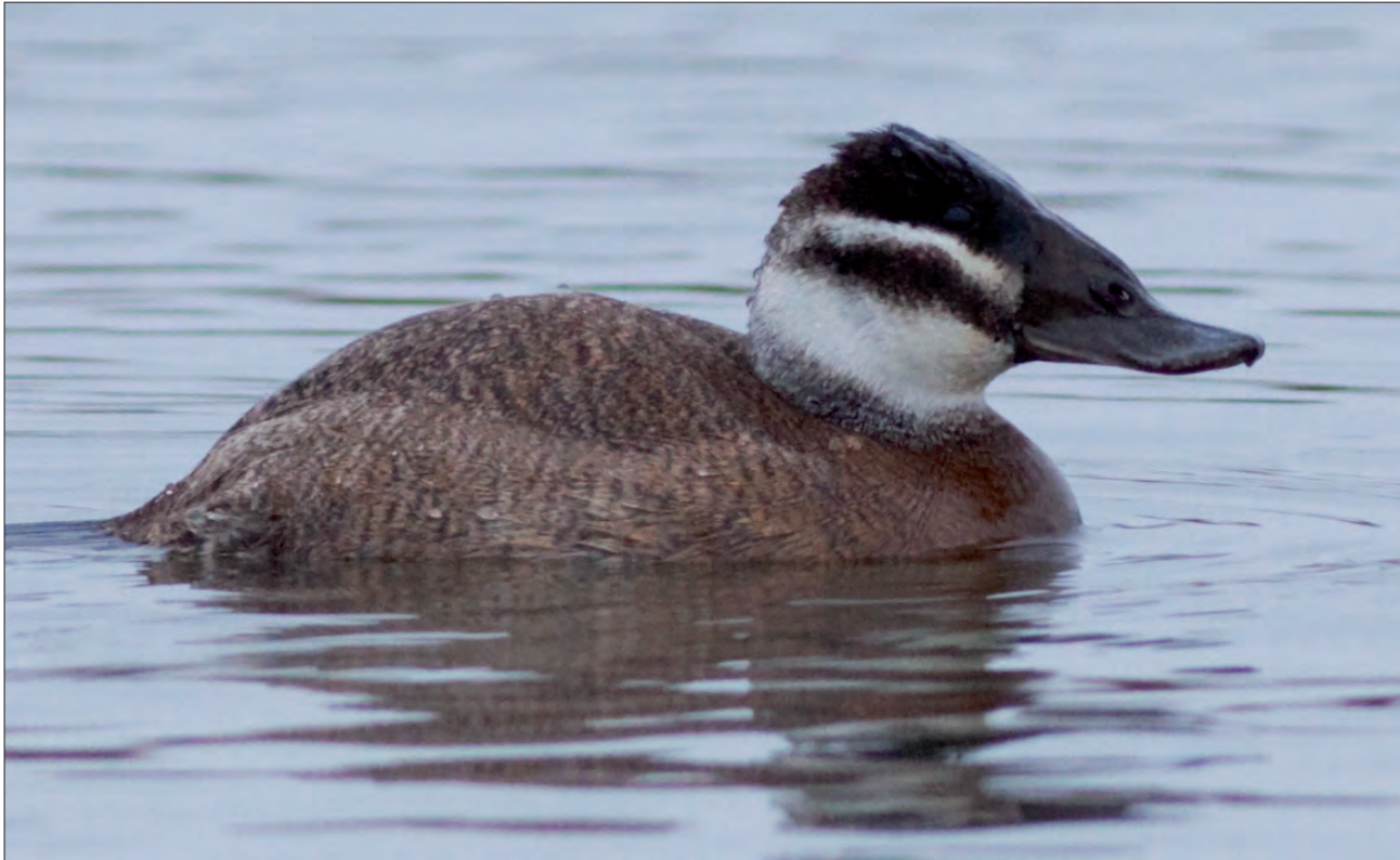
▲ Witkopeend, Zevenhuizerplas, 14 februari 2010.