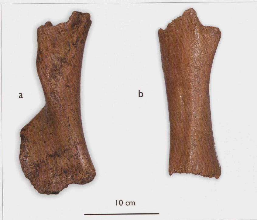
▲ Rechter opperarmbeen (a NMR 9991-0007068) en linker scheenbeen (b NMR 9991-0006937) van jonge wolharige mammoet met door hyena's aangevreten uiteinden.

zaterdag 18 augustus 2010. De elfde van de in totaal zestien trekken over de Noordzeebodem in het zuidelijke zandwingebied leverde die dag een bijzondere vondst op.