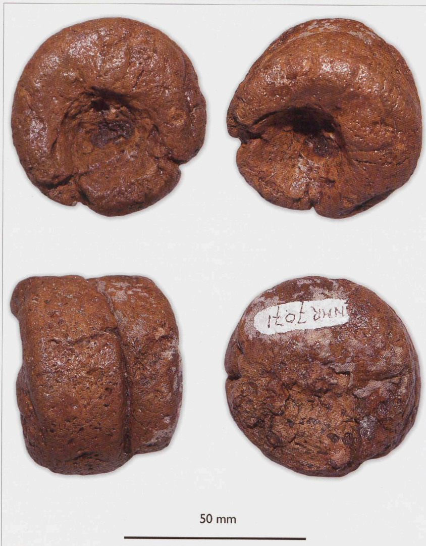
▲ De eerste keutel van grottenhyena Crocuta crocuta spelaea (NMR 9991-0007071) opgevist uit de Noordzee, in verschillende aangezichten.