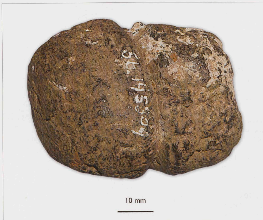
▲ Bijna twee miljoen jaar oude keutel van de uitgestorven hyenasoort Pliocrocota perrieri , opgevoist uit de Oosterschelde; collectie NCB Naturalis, St. 145309.

Coprolieten van hyena uit het Laat-Pleistoceen zijn tot nu toe van de Noordzeebodem niet bekend, althans, ze zijn nooit herkend. Wel zijn ze volop bekend uit grotten in Midden- en Centraal-Europa. Onder