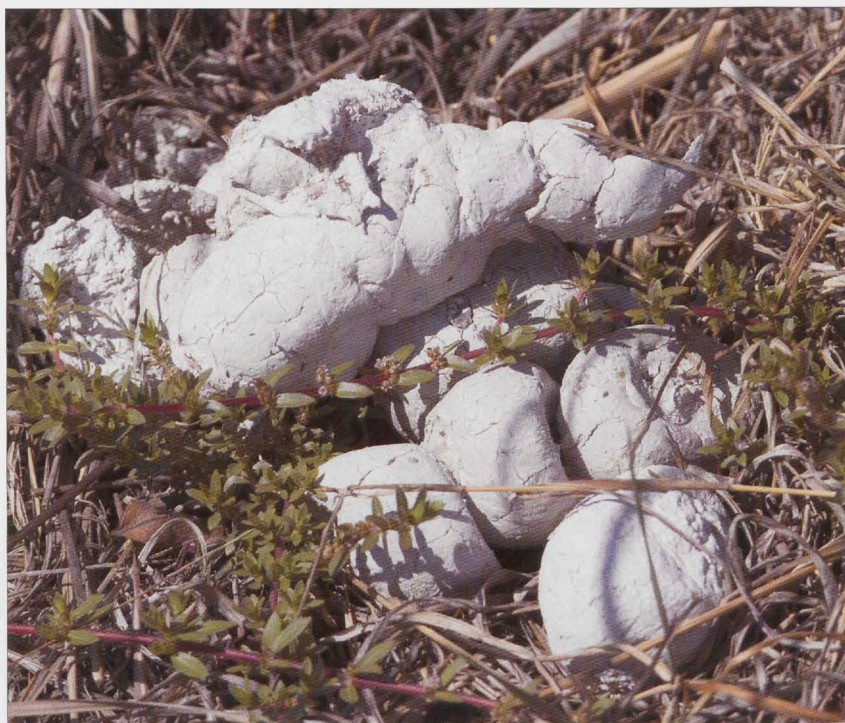
▲ Een verse hyenadrol gedeponeerd op de Afrikaanse savanne.