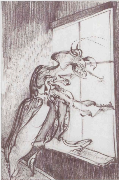
▲ Metamorfose. (Martin Linnartz)

alleen in Nederland maar ook elders in Europa. Hij kreeg vele prijzen.