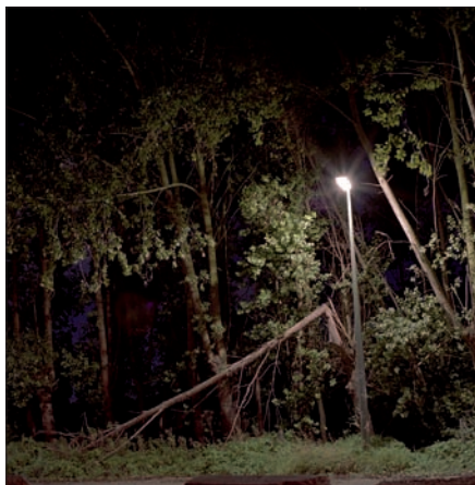
▲ Rabbits can't swim #1. (Cindy Jansen)