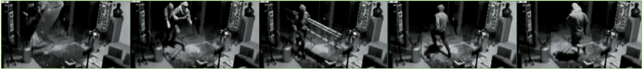
▲ Beelden van de inbraak, opgenomen met een bewakingscamera.