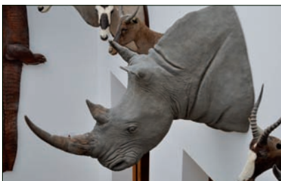
▲ De neushoornkop in betere tijden, juli 2011.

De diefstal riep en roept de vraag op of het museum er verstandig aan heeft gedaan om de neushoorn te laten hangen. Sommige andere musea hebben er voor gekozen om replica's tentoon te stellen. Zoals al gezegd heeft dat niet geholpen om inbraken te voorkomen: op meerdere plekken zijn plastic nephoorns ontvreemd. De schade die we hadden (een vernielde kop, een kapotte voordeur, een deuk in het parket, plus emotionele schade) zouden we daarmee dus niet hebben voorkomen. Bovendien hing bij de kop (die zelf wel een replica was) een bordje waarop stond: 'replica'. Dat de hoorns van echt hoorn waren heeft er nooit bij vermeld gestaan. De inbraak zouden we met een replica dus vrijwel zeker niet hebben voorkomen.