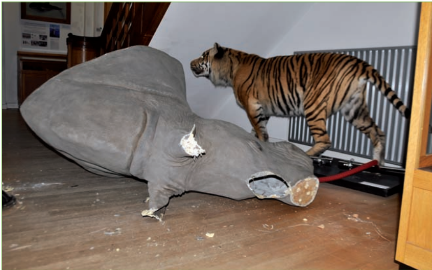
▲ De neushoornkop zoals aangetroffen na de inbraak op 26 augustus 2011.