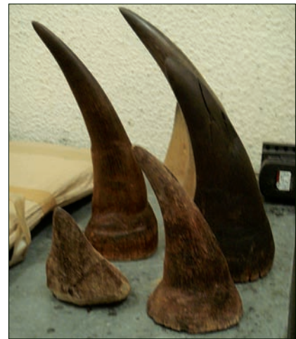
▲ Neushoornhoorns in beslag genomen in Portugal, september 2011.

De vernielde en ont hoornde kop wordt nu gerestaureerd, en - omdat we nu geen keuze meer hebben - voorzien van kunststof