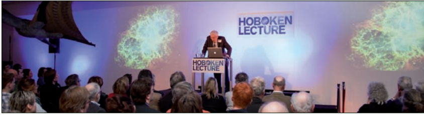
▲ Lord Martin Rees hield de eerste Hoboken Lecture in 2011.