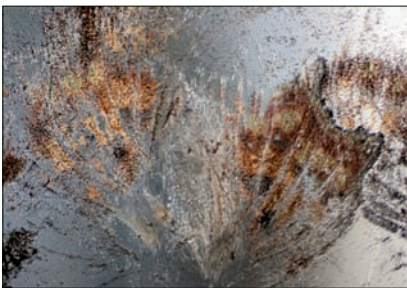
▲ Liquid File. (Egied Simons)

Vanaf 21 april exposeert het museum de 'Liquid Files' van de Rotterdamse kunstenaar Egied Simons. Als beeldhouwer bouwt Simons met ieder materiaal, ook het meest fragiele en vergankelijke: hij schildert in licht met de materie zelf, zonder tussenkomst van film of digitalisering. In zijn onderzoek naar structuren, gelaagdheid, openheid en verdichting construeert hij landschappelijke sferen. Met behulp