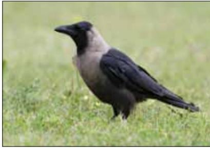
▲ Sinds augustus 2012 is een huiskraai van ondersoort Corvus splendens zugmayeri in Hoek van Holland aanwezig; 28 augustus 2012.