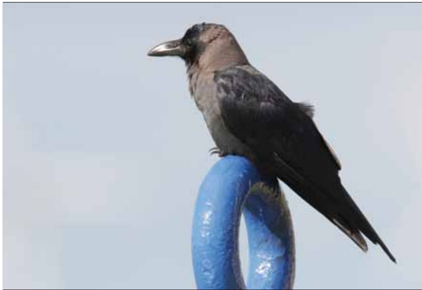
▲ De Hoekse huiskraaien verblijven vaak tussen de steigers in de haven. Hoek van Holland, 17 september 2005.

In opdracht van Team Invasieve Exoten van het Ministerie van EL&I