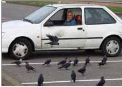
▲ Huiskraaien en kauwen bij een geliefde voedselbron. Hoek van Holland, 28 oktober 2012.

traditioneel de beste plek voor huiskraaien, zaten geen vogels. Het restaurant bleek op maandag gesloten te zijn, waardoor er geen frietjes en andere lekkernijen op de grond lagen. Dit zou de afwezigheid van huiskraaien aldaar goed kunnen verklaren.