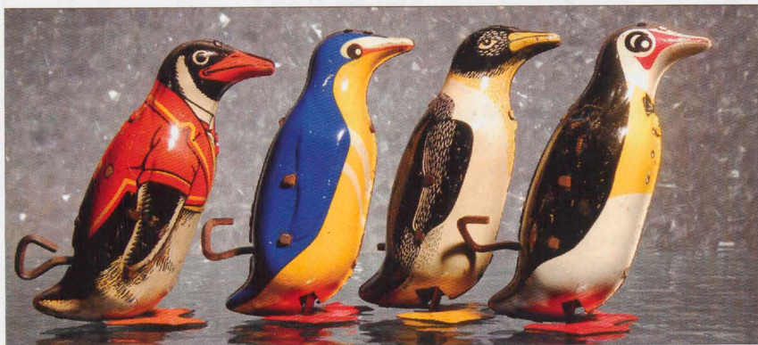
▲ Opwindbare pinguïns, uit 1940-1950.