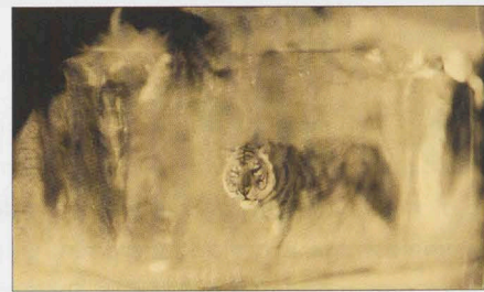
▲ Tiger. (Erik Hijweege)

De Rode lijst van de IUCN waarop meer dan 12.000 bedreigde diersoorten staan, inspireerde Erik Hijweege tot het samenstellen van het boek en de expositie 'Endangered'. Hiervoor fotografeerde de bevroren kunstenaar bedreigde diersoorten - diepgevroren in ijs - daarbij gebruik makend van het Natte Collodion Procedé uit 1851. Op die manier maakte hij unieke glasfoto's van tot de verbeelding sprekende dieren die op de een of andere manier in hun voortbe-