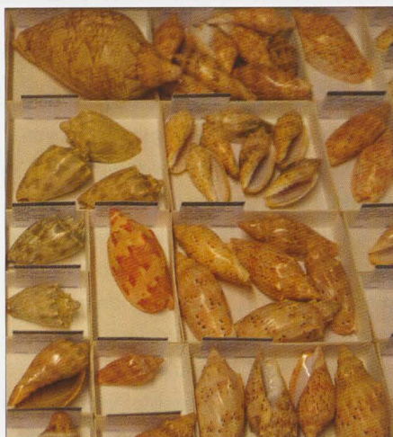
▲ Een willekeurige lade met schelpen uit de museumcollectie.