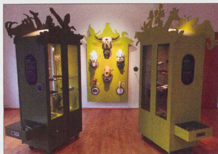
▲ 'Bewaren Natuurlijk' toont hoe en waarom het museum bewaart. (Kees Moeliker)

De collectie van Het Natuurhistorisch telt bijna 400.000 objecten. Waarom en vooral hoe deze natuurhistorische voorwerpen bewaard worden, is het onderwerp van de tentoonstelling 'Bewaren Natuurlijk'. In het (dankzij steun van de Vrienden van Het Natuurhistorisch)