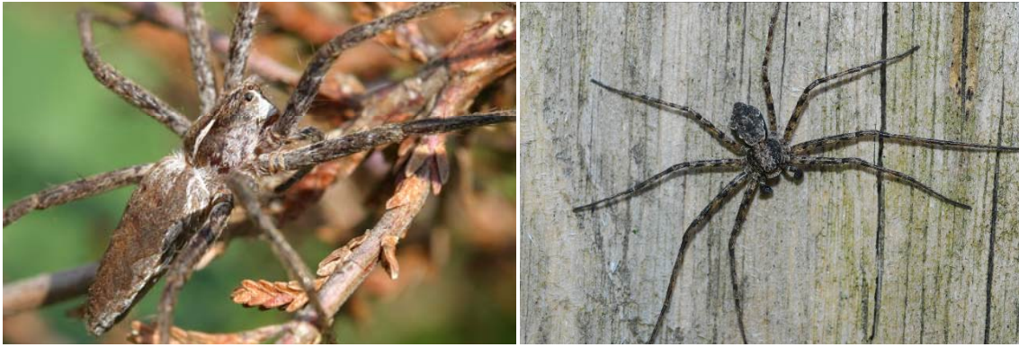
Fig. 3. Twee spinnensoorten uit het Roerdal: Pisaura mirabilis en Philodromus margaritatus.