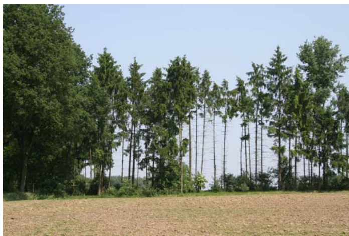
Fig. 2. Het kloppen van deze sparren langs natuurgebied De Muiltert leverde tien spinnensoorten op, waaronder Prinerigone vagans en Salticus zebraneus.

Melick & Sint-Odiliënberg (Roerdalen) , bezocht door Jinze Noordijk. Tijdens bezoeken aan deze dorpen op 6.vi.2013 konden twee spinnensoorten genoteerd worden die niet in de natuurgebieden of het overnachtingsterrein werden gezien. Ligging AC 197-351, 200-350.