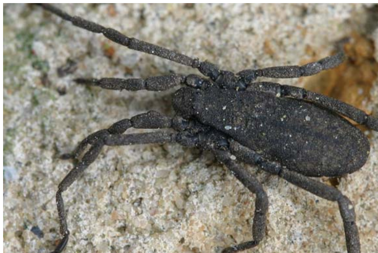
Fig. 4. De kaphooiwagen Trogulus closanicus.