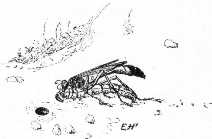
De rupsendoder (een graafwesp) brengt de verlamde prooi (een dennerups) in z'n holletje (Tekening van E. Heimans, gemaakt in de zomer van 1900)

Zo deden ook de zwart met witte vliegendoder, Mellinus sabulosus met hun vlieg, maar dat was niet zo'n zware vracht als een dikke snuitkever. Vliegendoders waren er van heel verschillende allure. Veel soorten van het geslacht Crabro (zeefwesp), waarvan de grootste en mooiste de tongbrekende naam droeg van Crabro cribrarius .