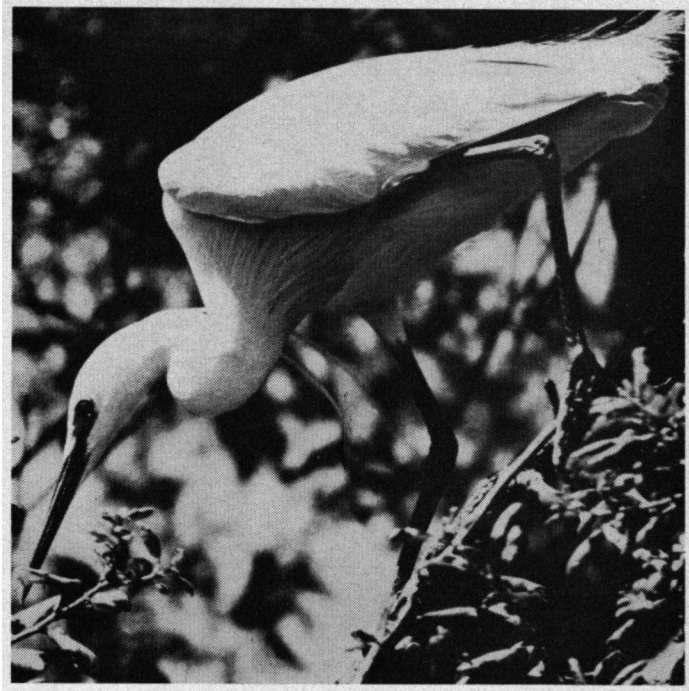
KLEINE ZILVERREIGER