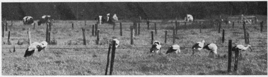
Zij begaven zich bij het krieken van de dag naar de weilanden

We moeten teruggaan tot 1959, toen de ooievaars voor de laatste keer poogden zich op het nest bij Mannus de Boer de Nunspeet te vestigen. Helaas mislukte die poging. Sindsdien bleven de ooievaars als plaatselijke broedvogels weg, hoewel het nest werd vernieuwd en ingericht volgens de — vermoedelijk — voor ooievaars geldende normen. In het najaar van 1968 verschenen nog twee op trek zijnde exemplaren, die niet eens zo ver van Mannus' nest neerstreken en er zich enkele dagen ophielden. Dat was vrijwel het gehele ooievaarsgebeuren van de laatste jaren. Helaas is het eveneens kenmerkend voor de gehele huidige Nederlandse broedpopulatie.