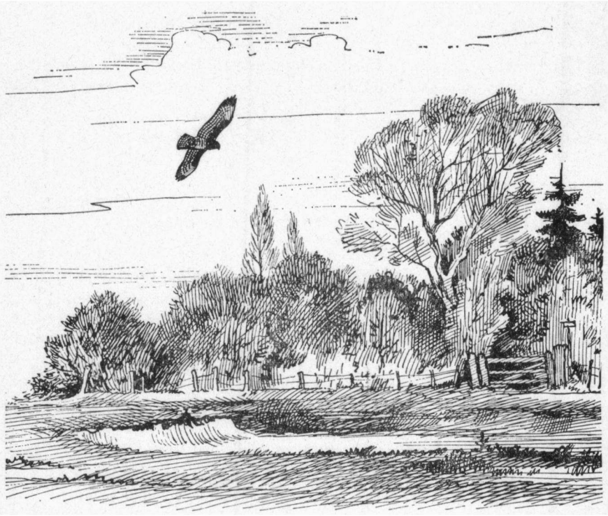
Buizerd in duikvlucht

We verbazen ons tegenwoordig nog wel eens over de zielskalmte waarmee meer of minder zeldzame stootvogels worden geschoten en over de trots waarmee de delinquenten zich met hun jachtbuit vervolgens laten afbeelden. Enig begrip voor deze stompzinnigheid krijgt men echter onwillekeurig indien men b.v. de nog in 1917 en 1922 uitgegeven vogelalbums onder ogen krijgt, die de Tabaksmaatschappij H. Oldenkott en zonen te Amsterdam in die jaren het licht deed zien. Voor de tekst van deze boekwerken, van wat kleiner