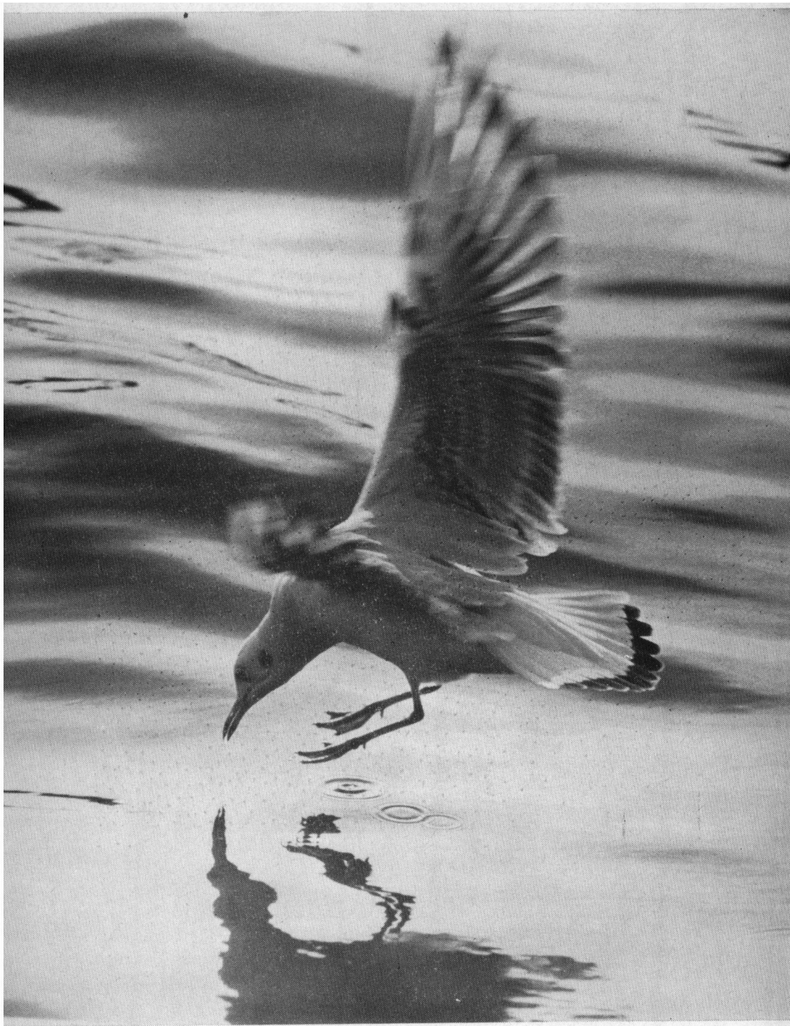
Jonge kokmeeuw, haven IJmuiden, oktober 1970. Yashica J.P., Tair 300 mm.