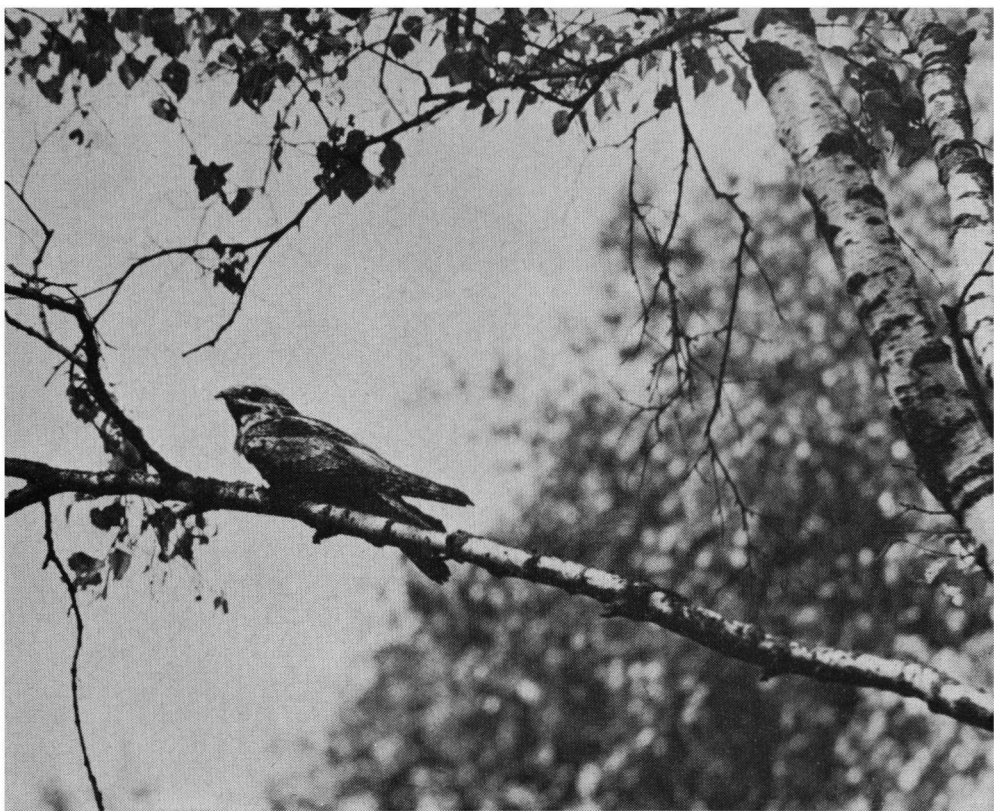
Nachtzwaluw, Planken Wambuis, Ede, juli 1959. Edixa reflex , Soliger 135 mm.