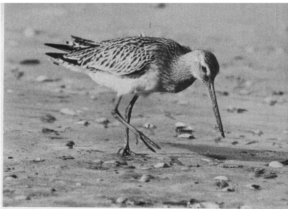
Rosse Grutto, Z.pier IJmuiden, 13 september 1970. Canon F.P., Hanimex 400 mm.