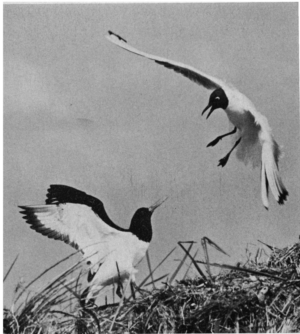
Visroevende kokmeeuw en scholekster, Griend, juni 1968 Leica, Telyt 280 mm.