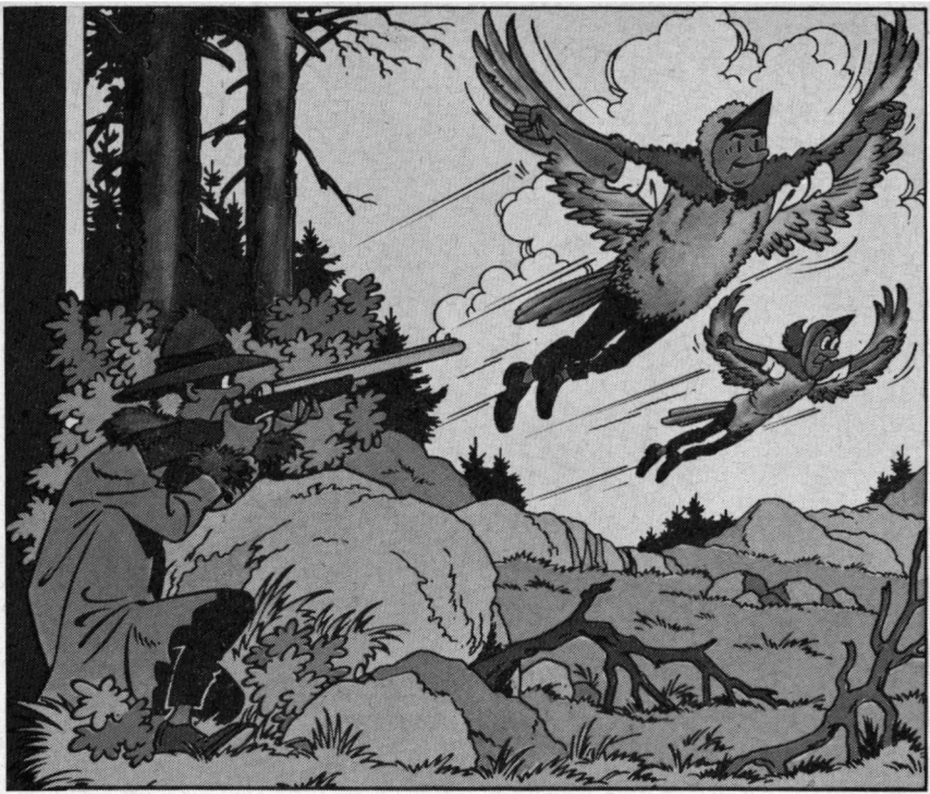
De toernige tjiftjaf van Suske en Wiske