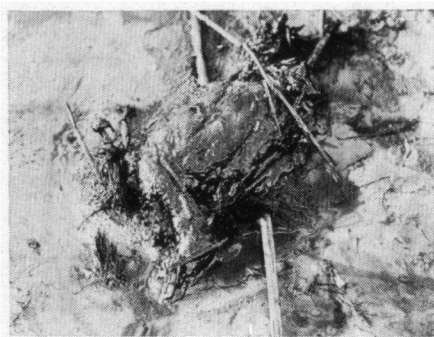
Deze „oliebol" was een eend

De vier kolossale tanks staan aan het randje van de rivier, dicht tegen elkaar. Aan de rivierzijde ontstond in een tank een scheur over de volle hoogte van de stalen wand, waarvan de dikte van onder naar boven verloopt van 22 mm tot 6 mm. Over totaal 2/3 van de omtrek scheurde de wand in de kim los van bodem en dak, draaide door de druk van de olie als een gigantische deur open en zakte later als nat karton in elkaar.