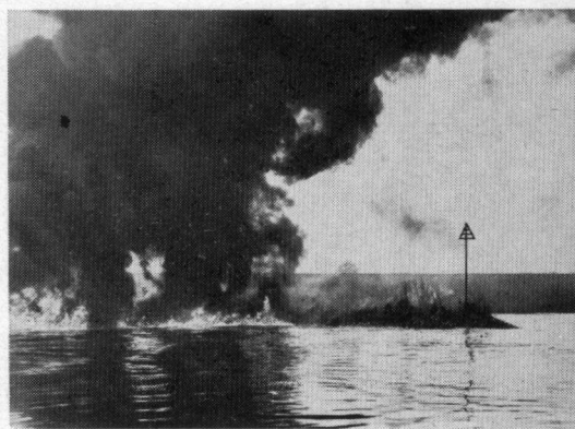
Oliebranden op 14 januari

In de vroege ochtend van zondag 27 december 1970 begaf plotseling een der grote olieopslagtanks van de Amercentrale der N.V. PNEM het. Over de oorzaak zijn alle deskundigen (waarvan er haast meer dan werkkrachten bij de ramp zijn betrokken geweest) het nog niet eens. Het doet weinig ter zake, een tank kan breken, scheuren, inploderen, in brand raken en ga zo maar door, een feit is echter dat menselijke onvolmaaktheid met zich meebrengt dat er steeds iets kan gebeuren dat niet was voorzien. Dit geval betrof een tank van 20.000 ton welke op dat moment 16.000 ton onmogelijk smerige olie bevatte, zwart als teer en een viscositeit vergelijkbaar met groene zeep.