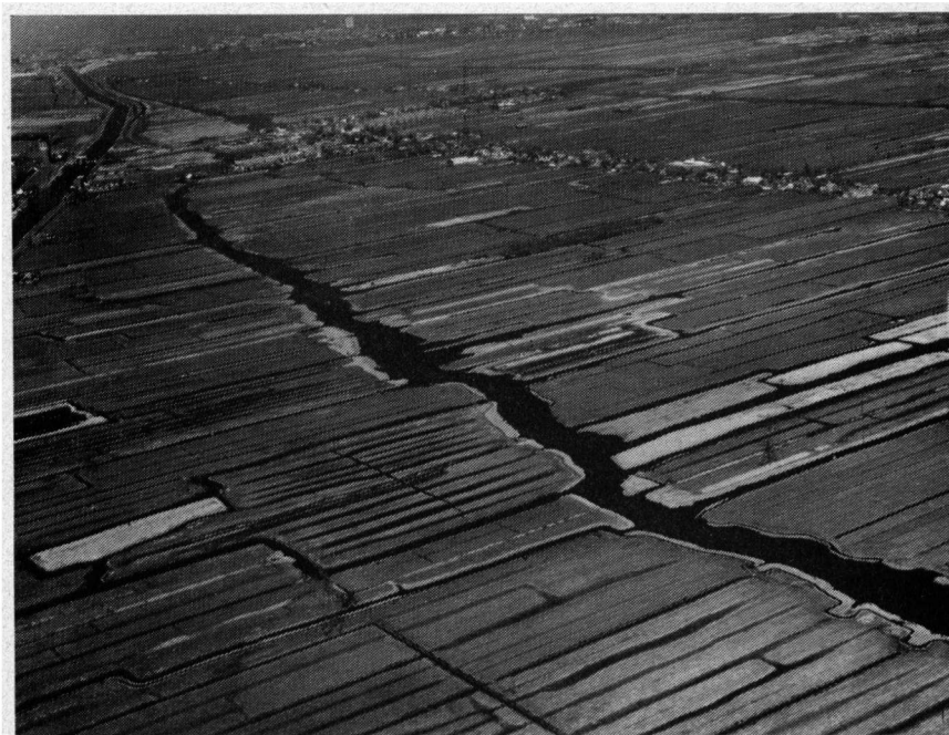
Westzijderveld tussen Westzaan en Nauernasevaart

De rapporten van de metingen van de luchtverontreiniging in het Noordzeekanaalgebied zouden de heer Knap kunnen leren dat het „luchtverontreinigingslawaaï” ook voor de mensen die hun geld verdienen in handel en transport een zaak van eerste orde in de strijd om het menselijk bestaan is. Voor de industrievestiging aan de Noordzijde van het Noordzeekanaal is op 29 februari 1968 vastgesteld het „Streekplan voor het Noordzeekanaalgebied”. De discussie hierover is in de Zaanstreek opnieuw aan de orde. Een belangrijk aandeel hierin heeft de „Zaanse Vogelwacht”. Deze heeft ingezien dat, wil men de toekomst van de nog in Nederland aanwezige vogels