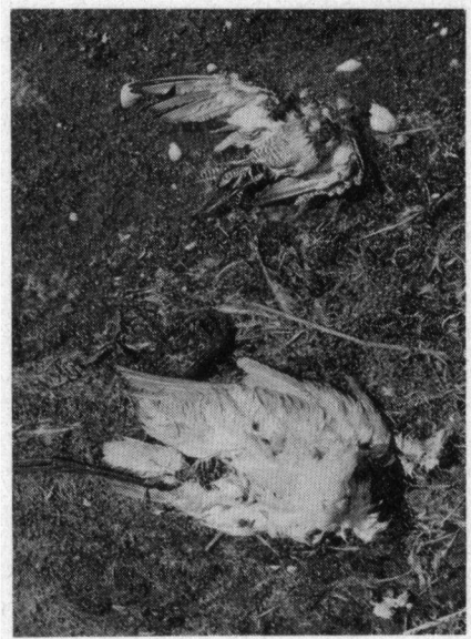
Dode lepelaar en zwarte ruiters . . .

Later ontdekte ik ter hoogte van paal 13, tussen een groep lepelaars, een stervende blauwe reiger. Pas toen ik weer in de richting van Muiderberg reed, drong het tot me door, dat er overal donkere hoopjes lagen. Toen herinnerde ik me de boven aangehaalde gevallen en ben eens goed gaan kijken. Ongeveer ter hoogte van paal 16 zag ik een dode jonge bergeend en tientallen dode talingen en meerkoeten op het slik liggen. Voorbij het gemaal zag ik nog een stervende jonge zilvermeeuw.