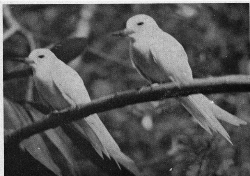
Witte sterns hebben de merkwaardige gewoonte hun ei op een dunne tak van een boom te leggen. Cousin Island.

In het zog van Vasco da Gama kwam in 1501 John de Nova naar dit gebied en men meent dat hij de Seychelles herontdekte. Hij gaf ze de naam van Farquhar. Vasco da