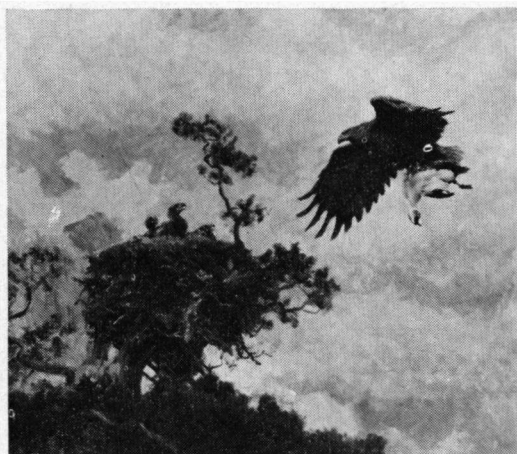
Zeearend boven horst, met jongen. Detail van schilderij van Bruno Andreas Liljefors. (1860-1939) Rijksmuseum Twenthe, Enschede

Een week in Sleeswijk-Holstein bij de zeearenden is een belevenis. De grootsheid van het beukenbos in de nabijheid van een groot meer en de ongerepte natuur, die het woongebied van de arenden vormt, oefent op ons moderne en gejaagde mensen een rustgevend invloed uit. Wij kunnen dan ook een ieder, die zich één à twee weken vrij kan maken, aanbevelen dit ook eens te ondernemen. Het is niet zo, dat de stilte je overvalt, want stil is het in deze windrijke omgeving niet. Heel het etmaal ruist en kraakt