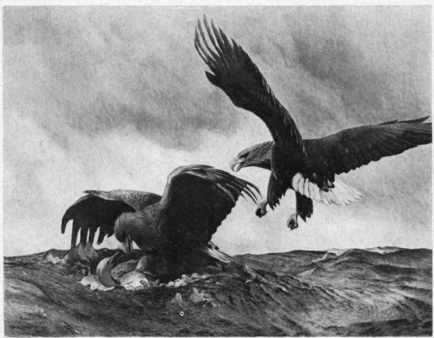
Zeearenden. Schilderij van Bruno Andreas Liljefors (1904).