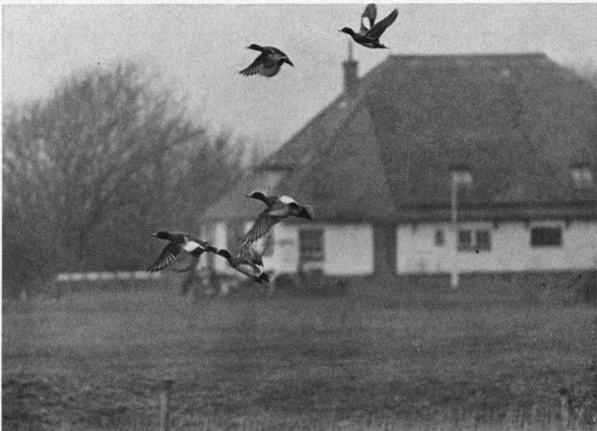
De silhouetten van de Smienten tegen het door de rietkragen, in vakken verdeelde, water doen zeer sfeervol aan ...

Vanaf 1967 heb ik zo rond de Kerst enige dagen doorgebracht op Texel en als ik de vogelwaarnemingen van nu vergelijk met die van voorgaande jaren valt de grote overeenkomst hier tussen op en ook het feit dat Texel een belangrijke plaats inneemt als overwinteringsplaats voor vogels. Zodra je de hoofdweg van het eiland oprijdt zie je in de weilanden achter de typische tuinwallen Kieviten en Wulpen, vaak met groepen Goudplevieren, terwijl een groot aantal Kramsvogels er aan het foerageren is. Van de hoofdweg slaan we rechtsaf richting Oudeschild en het moet raar gaan als uit de sloot niet een verontwaardigd schreeuwende Tureluur opvliegt om wippend op z'n tenen verderop naar de indringer te gaan staan schelden. Via Oudeschild direkt rechts af. Langs de elektrische centrale met ontziltingsinstallatie naar Dijkmanshuizen. Hier liggen de bekende plasjes, waarin tal van eenden en andere vogels zitten. We telden er dit jaar 300 Smienten, 35 Wintertalingen, 6 Slobeenden, 12 Steenlopers, 9 Kluten, 5 Zwarte Ruiters, 25 Tureluurs, 10 Bonte Strandlopers, 1 Rosse Grutto, 1 Oeverpieper, 1 Nonnetje en tot mijn verrassing ook een Lepeelaar, die zigzaggend zijn reusachtige snep door het water haalde. Laten we niet vergeten zo nu en dan even een blik te werpen over de dijk op het wad waar vaak Eiders en allerlei andere eenden liggen. Dan gaan we