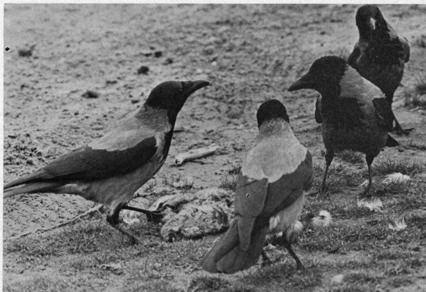
De Bonte Kraaien kunnen nauwelijks enige schade van betekenis aan de landbouw doen

Met de vervolging van de Bonte Kraai in Nederland komen we meteen bij een onzes inziens merkwaardig en onjuist feit binnen de Nederlandse vogelwetgeving. De Bonte Kraai valt op dit ogenblik namelijk onder de Jachtwet en wordt daarin onderverdeeld bij het 'schadelijk wild' (waaronder ook nog de volgende vogelsoorten voorkomen: Houtduif, Zwarte Kraai, Roek, Kauw, Vlaamse Gaai en Ekster). Eén en ander houdt in dat de jachthouder van een gebied min of meer verplicht is het schadelijk wild in zijn jachtgebied 'binnen de perken' te houden, maar bovendien dat de grondgebruiker het schadelijk wild zelf kan bejagen en ook anderen daartoe kan machtigen. Onder jagen wordt ook verstaan het opsporen, bemachtigen of doden van schadelijk wild, waarbij gebruik gemaakt mag worden van 'middelen geschikt tot delven of slaan, fretten, buidels en kastvallen'. Hierdoor behoeft men voor het vervolgen van