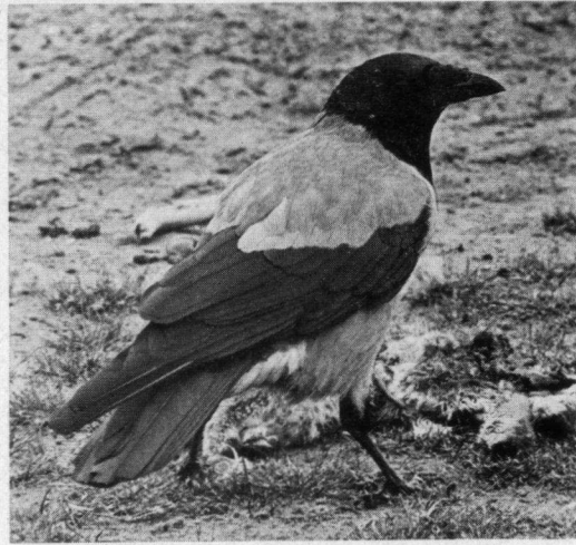
Met de vervolging van de Bonte Kraai in Nederland komen we meteen bij een merkwaardig en onjuist feit binnen de Nederlandse vogelwetgeving