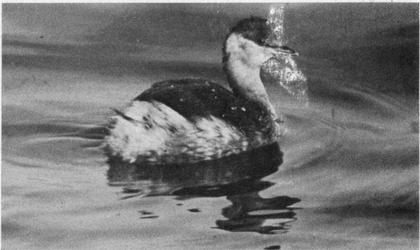
Dodaars in de haven van IJmuiden, januari 1973

Deze groepen zullen wij afzonderlijk behandelen. Voor enkele groepen kan worden volstaan met een verwijzing naar eerder in 'Het Vogeljaar' gepubliceerde artikelen. De data welke in de titel genoemd worden zijn dagen waarop opmerkelijke waarnemingen zijn gedaan. De op die dagen verkregen waarnemingen worden vergeleken met die van een drietal andere waarnemingsplaatsen langs de Nederlandse kust.