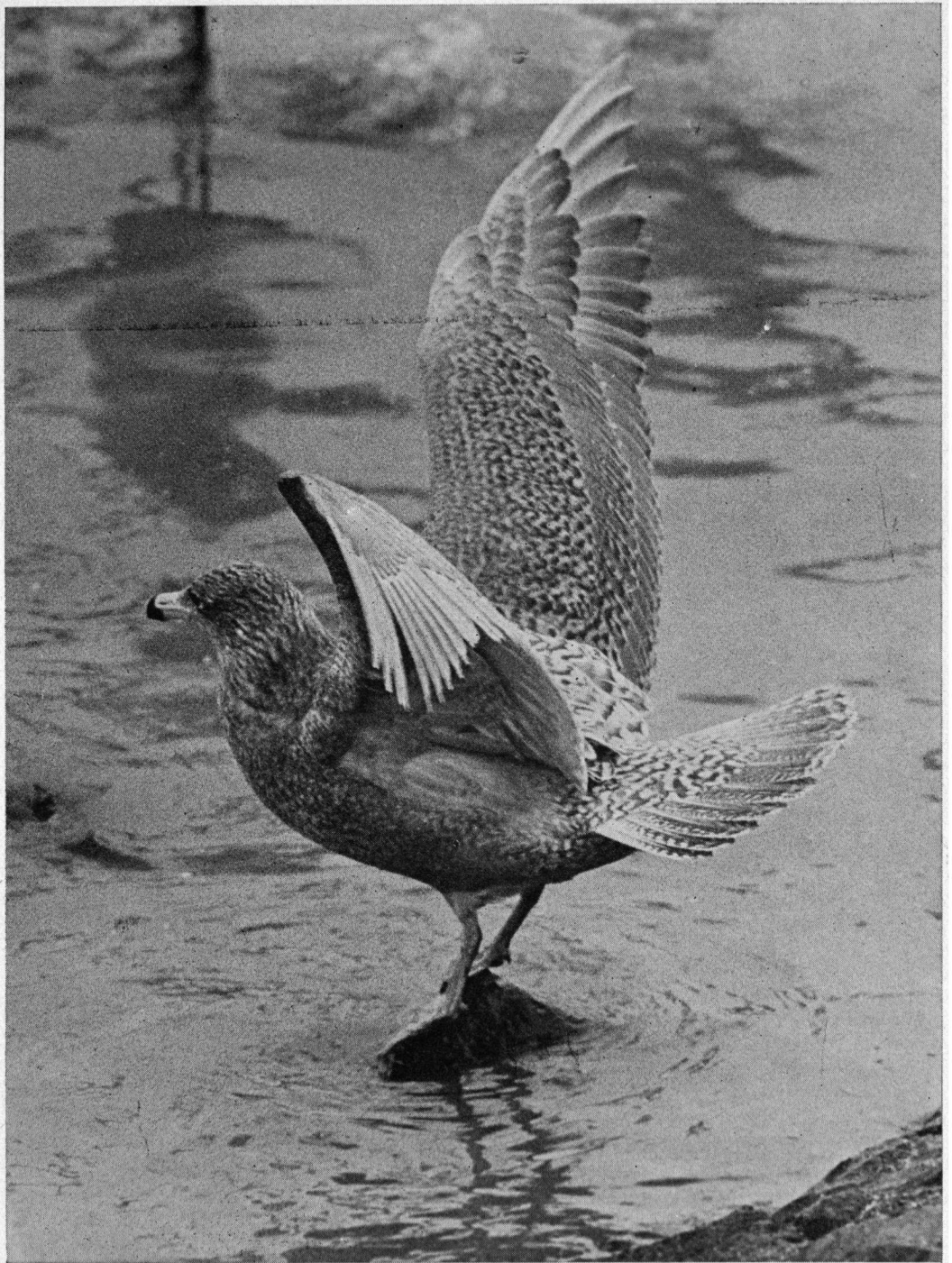
Jonge Grote Burgemeester, IJmulden januari 1973