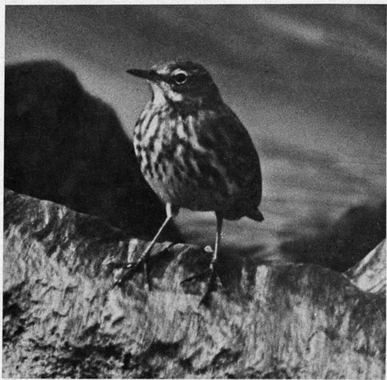
Oeverpleper overwintert op de pier

Wanneer er goede trek aan de gang is van landvogeltjes zou men in principe elke soort die over het land trekt, ook wel boven of op de pier