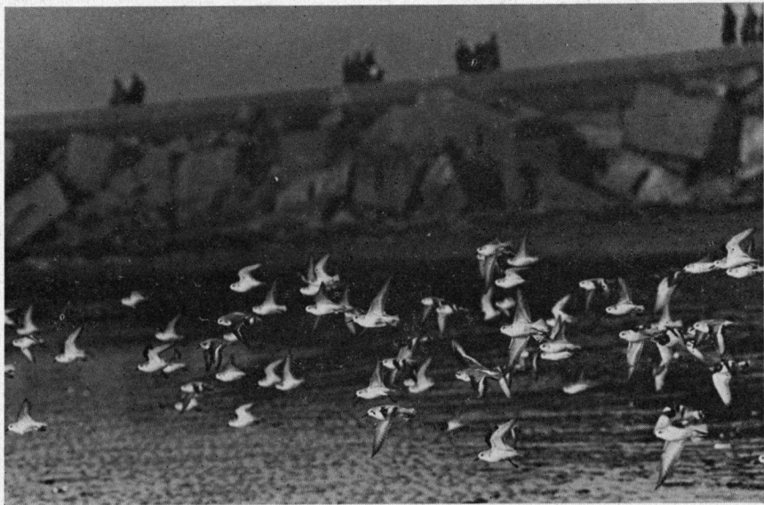
De pier van IJmuiden in de winter

Kluten trekken regelmatig langs in de trektijden, soms ver uit de kust.