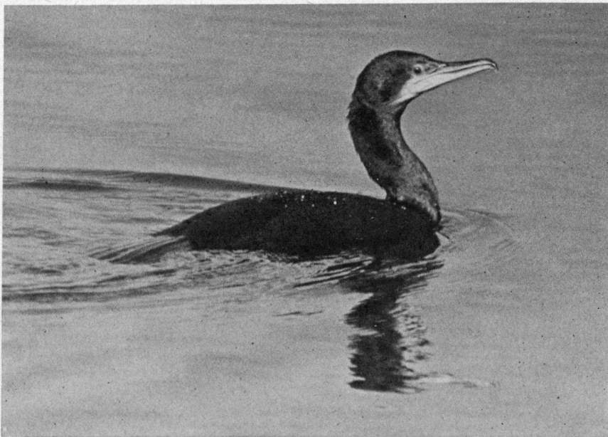
Aalscholvers worden in kleine aantallen bij de pier waargenomen .

Op de Hondsbossche Zeewering kampte men voorts met het probleem dat alles nogal ver uit de kust vloog. Daarbij maakten de ruwe branding en het ontbreken van bakens op zee het bijna onmogelijk een door één man ontdekte vogel de anderen aan te wijzen. Het is heel merkwaardig dat bijna alle hieronder genoemde vogels bij westenwind richting noord vlogen (vgl. Van Poelgeest in 'Het Vogeljaar' 20, nr. 2, blz. 59-63, hier vlogen de Pijlstormvogels op dezelfde data (van 1971) en bij dezelfde