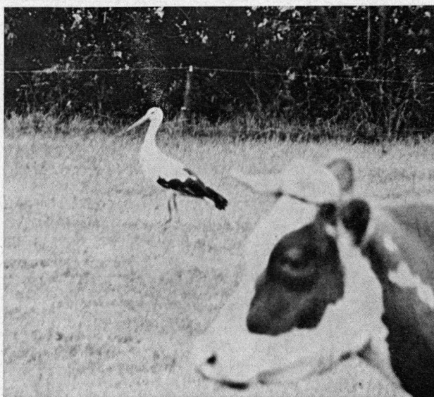
Foeragerend rondom Rommelgebergte, Winterswijk van 30-7 t/m 5-8-1973

Door de verschrikkelijke najaarsstormen van 1972 en de voorjaarsstormen van 1973 gingen tal van nesten verloren, zodat het nestenbestand in Nederland een flinke adering heeft moeten ondergaan. Maar liefst 17 nesten gingen verloren, die niet meer zullen worden bezet worden. Het enorme gure, koude en met stormen gepaard