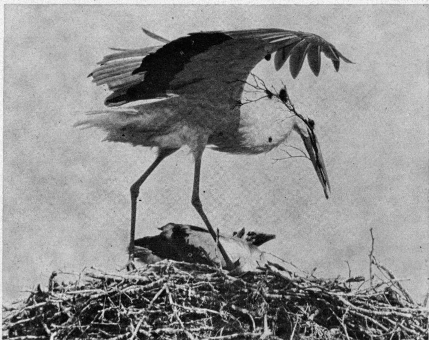
Frieslands laatste bewoonde ooievaarsnest te Luxwoude had in mei 1972 twee jongen