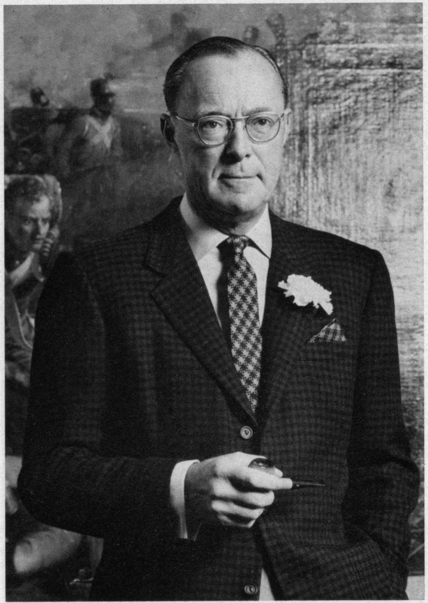
Z.K.H. de Prins der Nederlanden