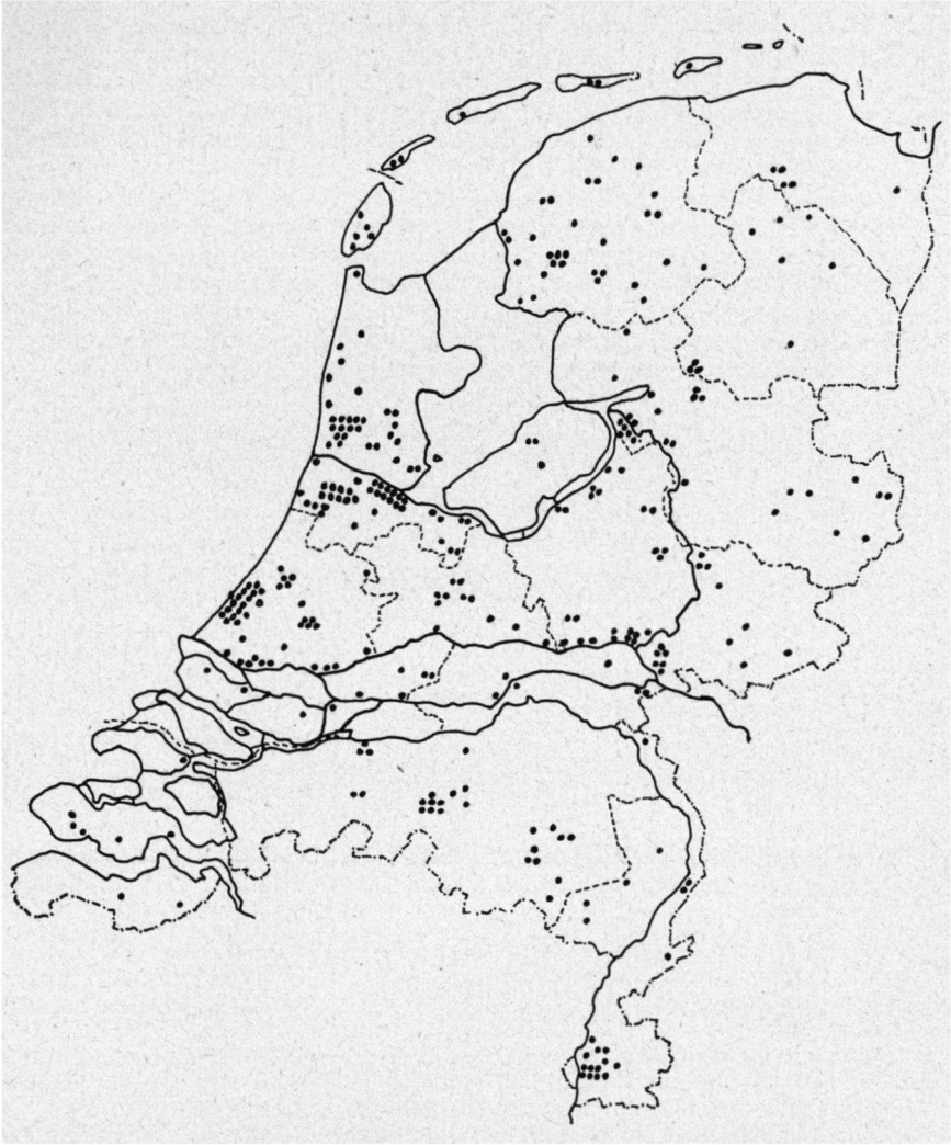
Kaartje van de verspreiding van de woonplaatsen van de medewerkers aan het ringonderzoek in Nederland naar de situatie per 1 juni 1973