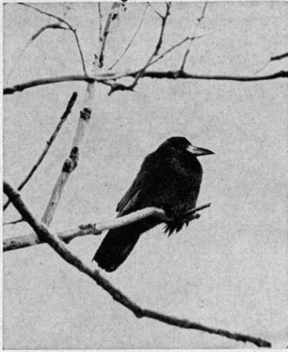
Een andere bij vogelbeschermers levende wens is om de Roek te beschermen

helaas door elke opsporingsambtenaar kunnen worden verleend voor een allereerste legalisering, te vaak, zonder onderzoek naar de herkomst, worden afgegeven. Bij preparateurs blijken de dode vogels te kunnen worden 'ondergeschoven'.