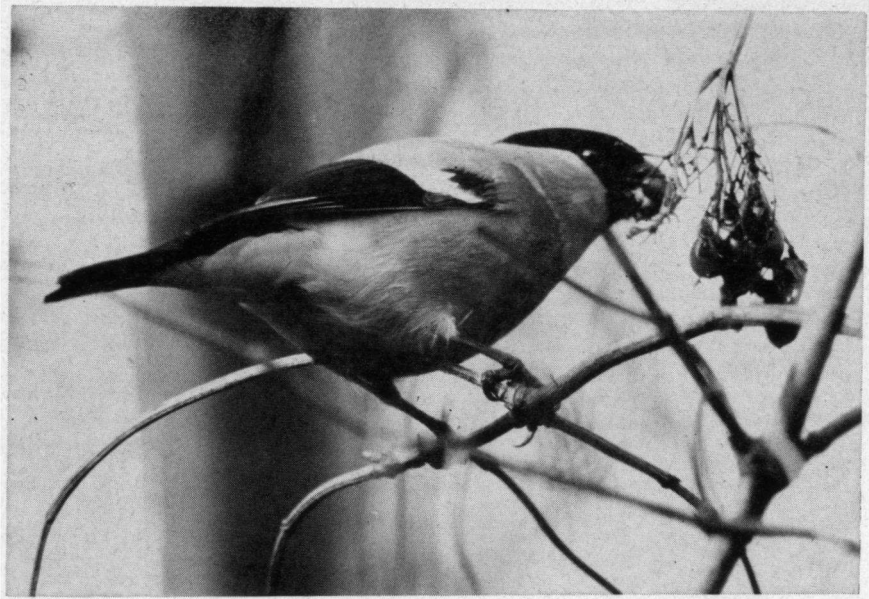
De Goudvink, een omstreden figuur in de Vogelwet 1936